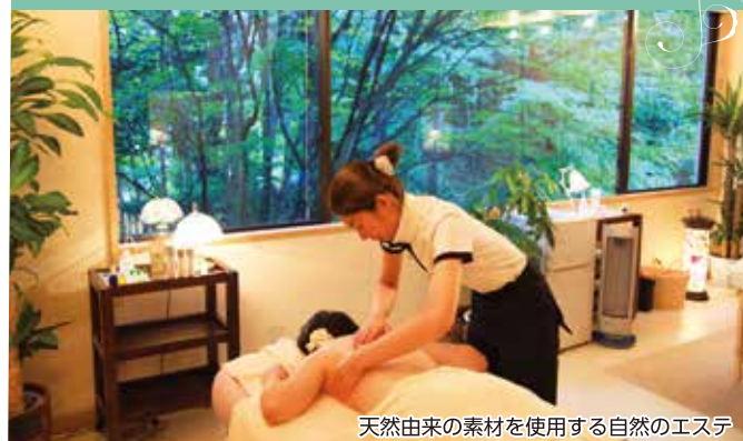
天然由来の素材を使用する自然のエステ