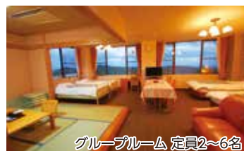
グループルーム 定員2~6名