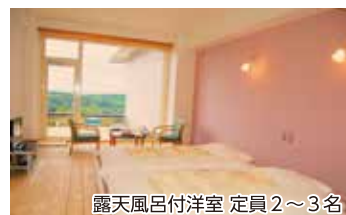
露天風呂付洋室 定員2~3名

「自ら美しくなる・健康になる・心と体が癒される」ことに特化したご宿泊は、癒しとリフレッシュ効果を最大限に感じることが出来る贅沢なひとときです。高付加価値&リーズナブル価格でのご宿泊をぜひご体験ください。